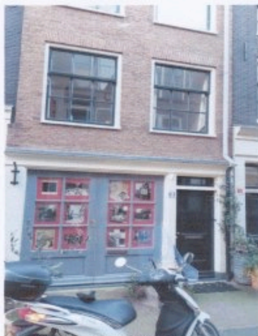
Hoera , we hebben een locatie in de Jordaan.

Met Villa Kakofonie creëren we een unieke culturele ruimte waar geschiedenis, kunst en verbinding samenkomen, en we kijken ernaar uit om dit bijzondere project samen met ons gedreven team verder vorm te geven.