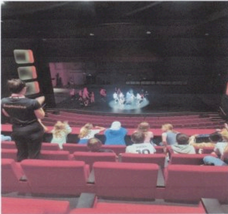
Classic Tour in de stadsschouwburg Utrecht 2023.