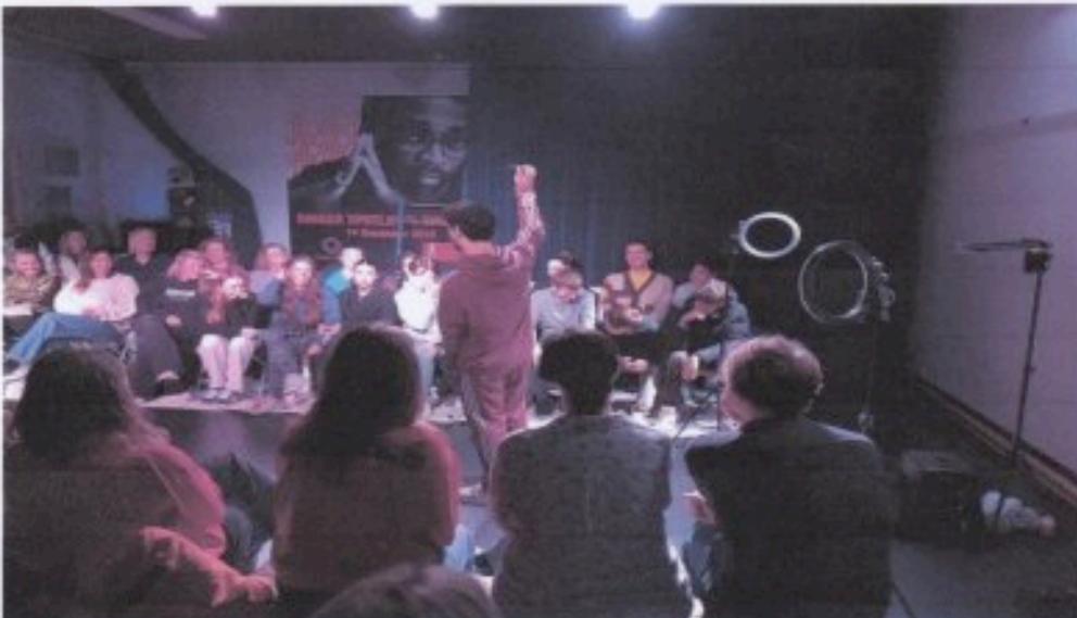
Foto Project Ik in Theater Zuidplein 2023.