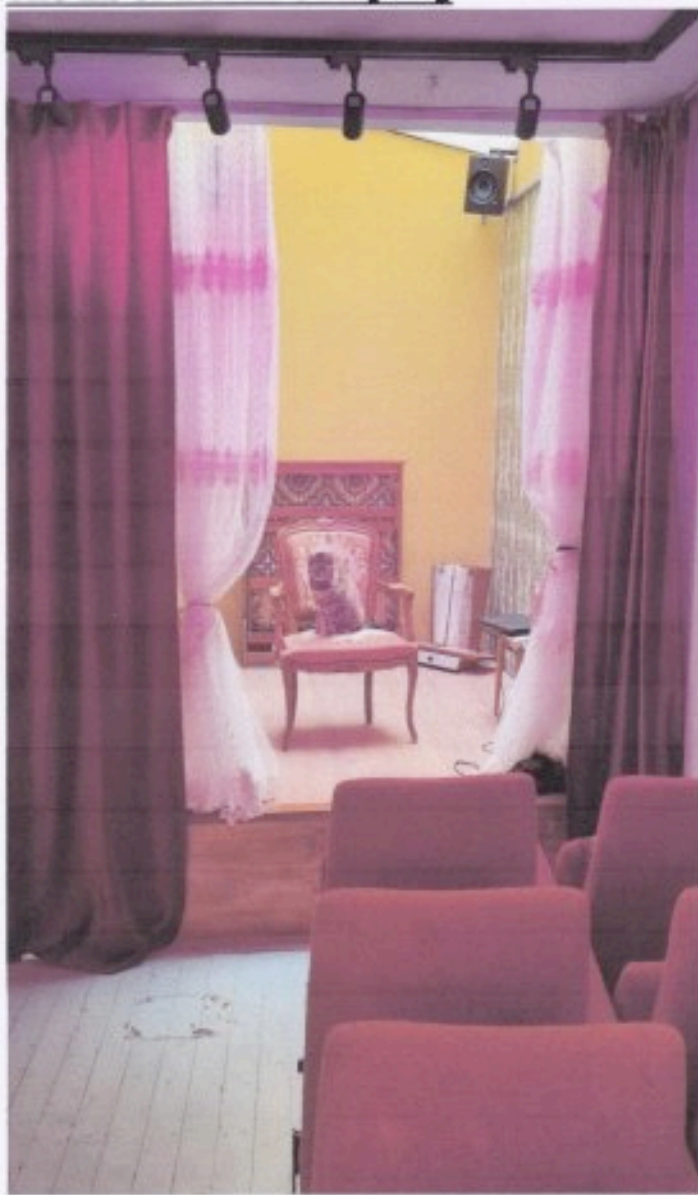
Foto van nieuwe locatie met huiskat Nouri